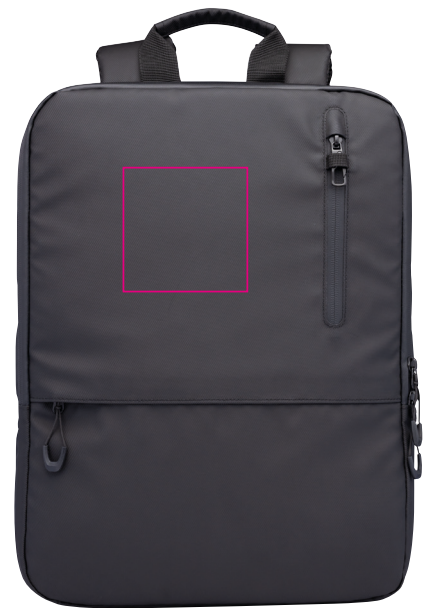
Abbildung oben 1:1

Laptop-Rucksack mit 2 großen Fächern (gepolstertes Laptopfach bis 16" und Hauptfach) mit 2-Wege Reißverschluss, erweiterbar durch zusätzlichen Reißverschluss, 1 Fronttasche mit versteckbarem Reißverschluss-Schieber als Mini-Karabiner (Diebstahlschutz) + zusätzliches Frontfach, expandiert 2 Netztaschen für Flasche und Schirm, verstärkter Standboden, Schlaufe zur Befestigung am Trolley, Tragegriff, versteckte Rucksackgurte, wasserabweisende Reißverschlüsse außen, widerstandsfähiges Material, spritzwassergeschützt (Wasserdichtheitsgrad IPX4), Kapazität von ca. 6 Liter auf ca. 14 Liter erweiterbar, Tarpaulin: 80% Polyester, 20% Polyurethan (PU), Polyester, Polyurethan, Tarpaulin (Plane), schwarz